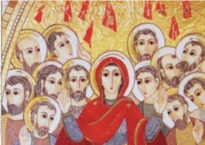
Illustration P. Marko Ivan Rupnik

Écouter la Parole c'est aussi découvrir quelque chose dans le texte que je ne connaissais pas