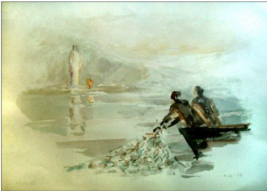
Aquarelle de Madeleine Diener

Une artiste a représenté cette scène. Regardons-la d'abord en silence. Que nous dit cette aquarelle ?